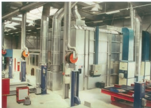
Construction d'un Centre de Maintenance de Poids Lourds en Irak

Après plusieurs années de persévérance et de ténacité, FRANCARE retrouve son chiffre d'affaires d'avant la guerre du Golfe. En parallèle, afin d'optimiser ses performances et sa productivité, un nouveau système informatique de gestion est mis en place, qui s'avère primordial dans l'organisation de la société. Les équipes commerciales s'accroissent également et atteignent le nombre de 15 collaborateurs.